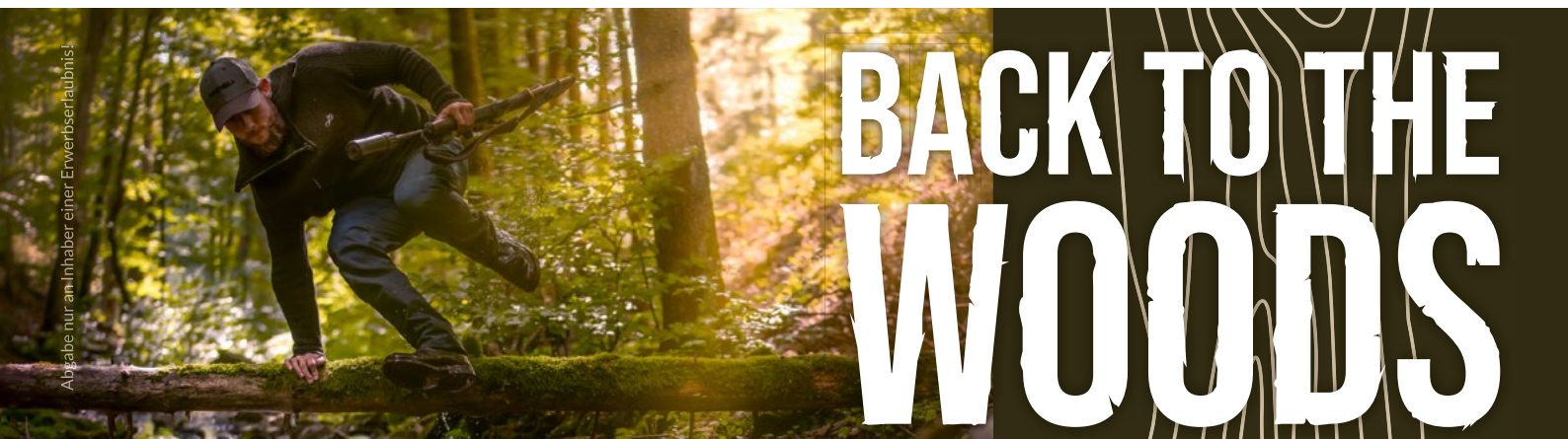
Abgabe nur an Inhaber einer Erwerbserlaubnis!